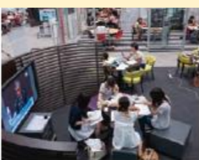
Doshisha Learning Commons