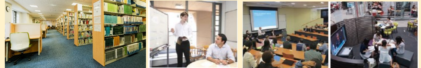
Library Project Room Classroom Doshisha Learning Commons

Sekolah Bisnis kami terletak di Gedung modern bernama Kambaikan di kampus Doshisha Imadegawa, dibutuhkan hanya lima menit dengan berjalan kaki dari Kyoto Imperial Palace. Selain ruang kelas, fasilitas lain termasuk ruang proyek, ruang tunggu, dan perpustakaan sekolah bisnis dapat diakses dan terbuka 24 jam, 365 hari setiap tahunnya dikhususkan untuk para mahasiswa MBA .