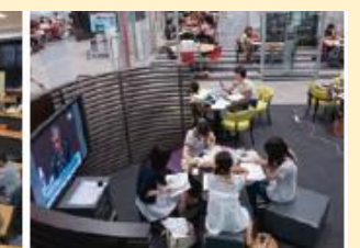
Doshisha Learning Commons