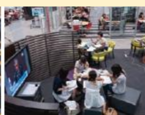
Doshisha Learning Commons